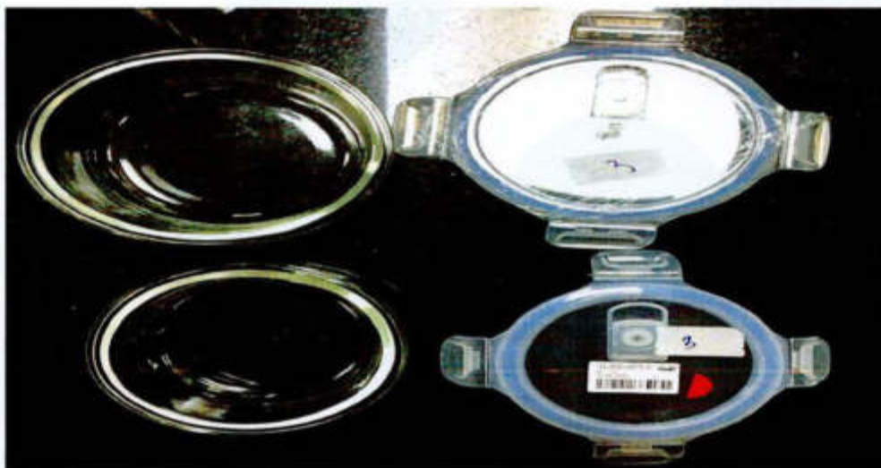
Hình ảnh mẫu nhận được

5885 CÔNG TY THỰC PHẨM OFFICE HẢI PHÒNG HỒ