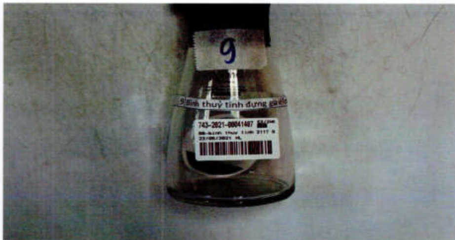
Hình ảnh mẫu nhận được