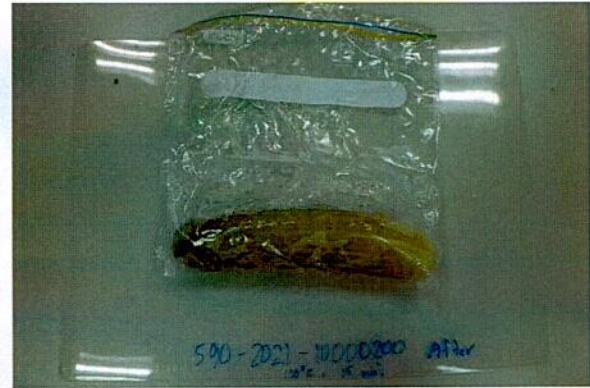
Sample after test / Mẫu sau khi thử nghiệm