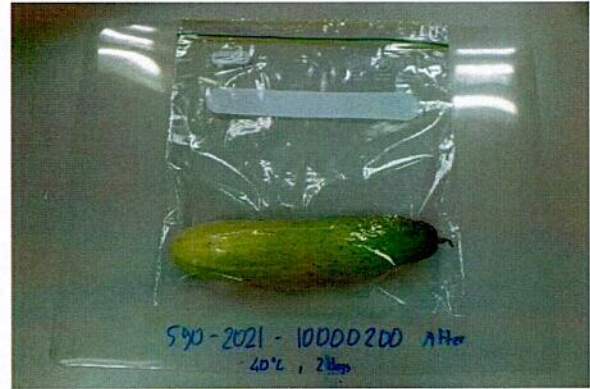
Sample after test / Mẫu sau khi thử nghiệm