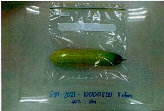
Sample before test / Mẫu trước khi thử nghiệm