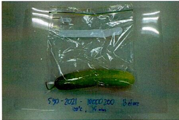
Sample before test / Mẫu trước khi thử nghiệm