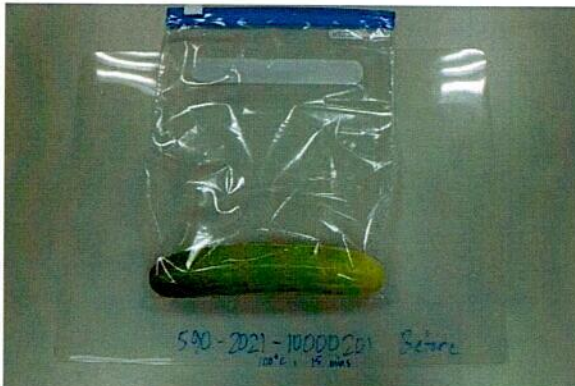
Sample before test / Mẫu trước khi thử nghiệm