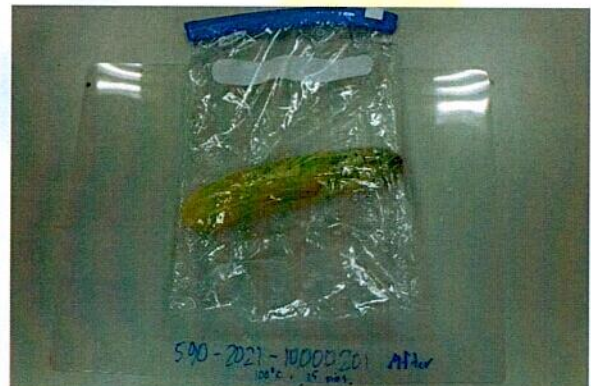
Sample after test / Mẫu sau khi thử nghiệm