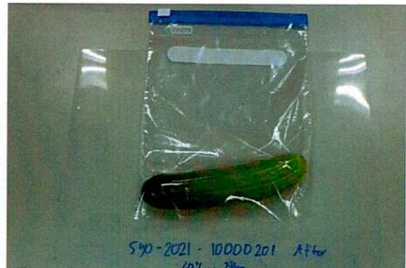
Sample after test / Mẫu sau khi thử nghiệm