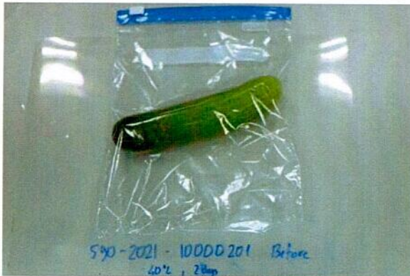
Sample before test / Mẫu trước khi thử nghiệm