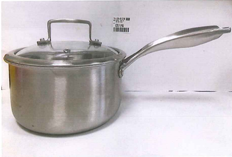
HÌNH ẢNH MẪU NHẬN ĐƯỢC