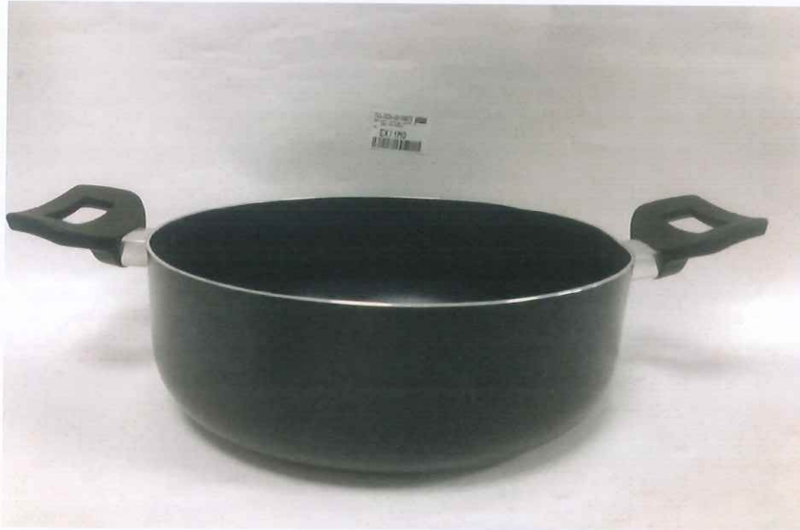
HÌNH ẢNH MẪU NHẬN ĐƯỢC