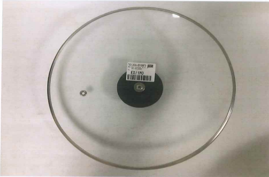
HÌNH ẢNH MẪU NHẬN ĐƯỢC